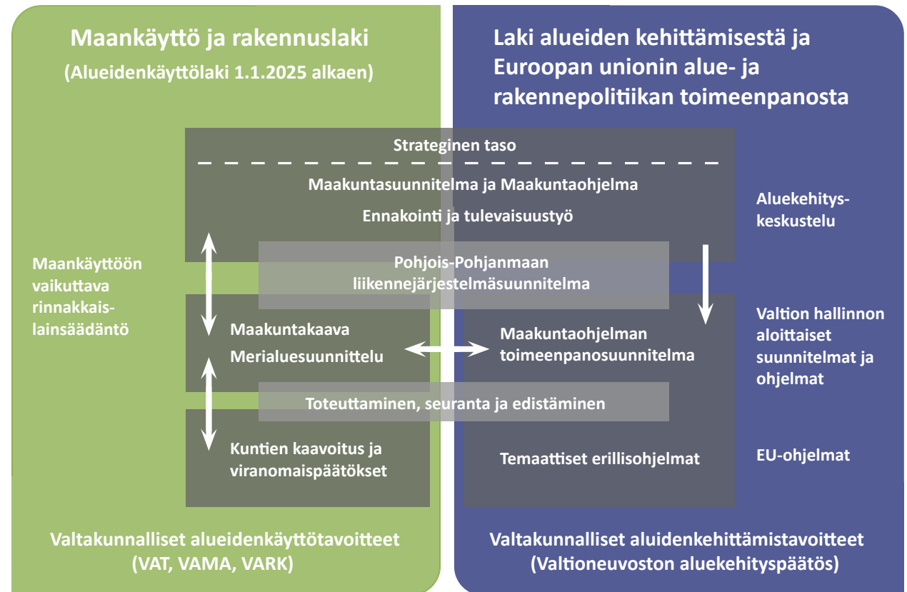
Kuva 1. Pohjois-Pohjanmaan maakunnan suunnittelujärjestelmä perustuu kahteen lainsäädäntöön. Maankäyttö- ja rakennuslain (MRL) uudistaminen on käynnissä ja uusi aluekehityslaki on tullut voimaan 1.9.2021 ( Laki alueiden kehittämisestä ja Euroopan unionin alue- ja rakennepolitiikan toimeenpanosta , 756/2021).

Maakunnan suunnittelujärjestelmään (MRL 4 luku) kuuluvat alueiden käytön suunnittelua ohjaavien maakuntakaavan ja liikennejärjestelmäsuunnitelman lisäksi alueellinen kehittämissuunnitelma eli maakuntaohjelma (MAKO), josta säädetään erikseen ( Laki alueiden kehittämisestä ja Euroopan unionin alue- ja rakennepolitiikan toimeenpanosta 757/2021 , ALKE-laki). Pohjois-Pohjanmaan maakuntaohjelma 2022-2025 hyväksyttiin maakuntavaltuustossa 13.12.2021 (§ 28). Pohjois-Pohjanmaan liikennejärjestelmäsuunnitelma 2040:n toimintalinjat (P-P-LJS 2040 TL1-TL4) toteuttavat Pohjois-Pohjanmaan maakuntaohjelman 2017-2021 Saavutettavuusteemaa. Maakunnallisen liikennejärjestelmäsuunnitelman päivitys käynnistyy vuodenvaihteessa 2023-2024.