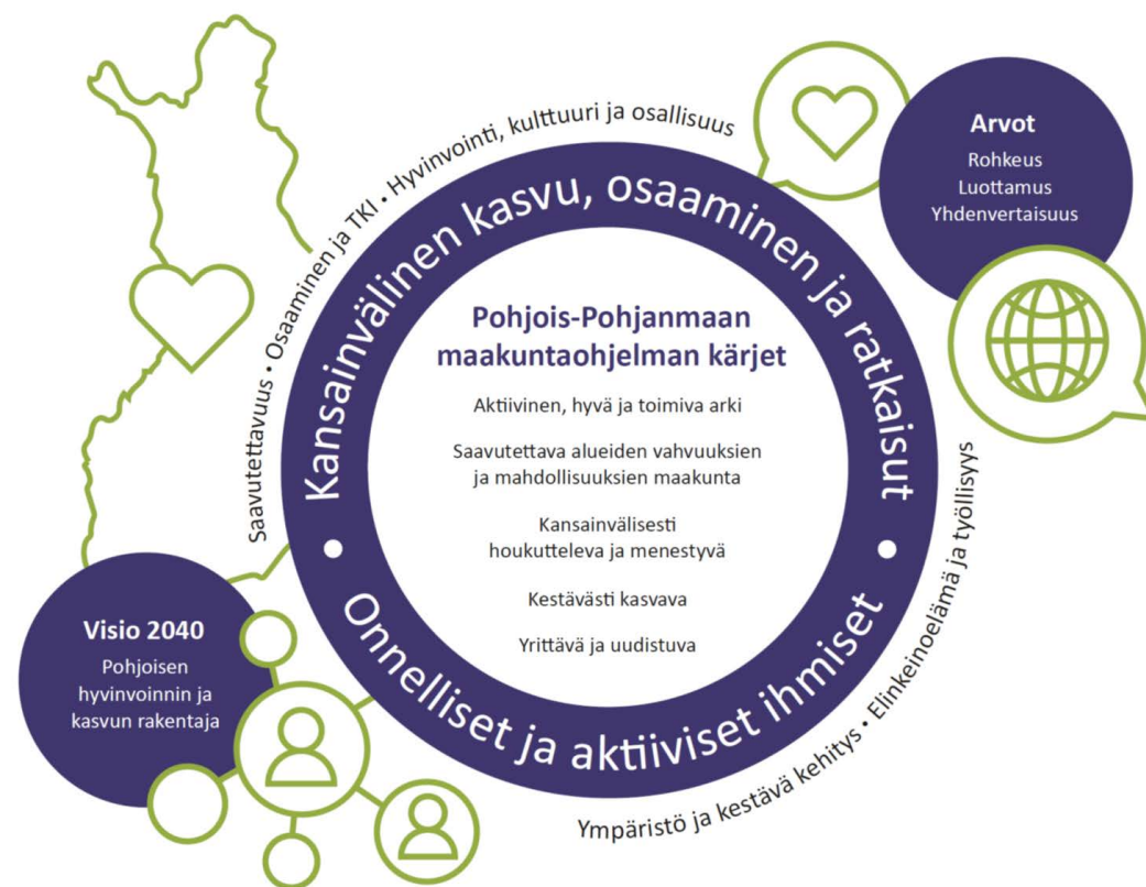
Kuva 3. Pohjois-Pohjanmaan maakuntaohjelman 2022-2025 kärkiteemat, arvot ja visiot (Julkaisu A:65, PPL).

Maakuntaohjelman toimeenpanoprosessia kehitetään vastaamaan aluekehittämisen tilannekuvaa sekä valtion ja maakunnan välistä aluekehityskeskustelua. Toimeenpano sisältää toimijoiden välistä läheistä yhteistyötä, kumppanuutta, jossa kullakin toimijalla on oma merkittävä roolinsa. Yhteisen prosessin kautta muotoutunut aluekehittämisen arvoperusta oikeuttaa ja velvoittaa kaikkia maakunnan tulevaisuuden tekijöitä.