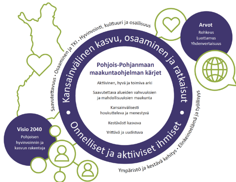
Kuva 3. Pohjois-Pohjanmaan maakuntaohjelman 2022-2025 kärkiteemat, arvot ja visiot (Julkaisu A:65, PPL).

Maakuntaohjelma perustuu maakuntastrategiaan, joka sisältää maakunnan kehittämisen tavoitteet, kuvaukset keskeisistä toimenpiteistä ja kärkihankkeista sekä tarkemmat rahoitussuunnitelmat (Kuva 3). Maakuntaohjelman tavoitteille asetetaan mittarit ja vaikuttavuustavoitteet. Tavoitteiden ja kärkihankkeiden toteutumista, toimenpiteitä ja niiden vaikutuksia seurataan laadullisen ja määrällisen seurannan kautta. Maakuntaohjelman toimeenpano - prosessia kehitetään vastaamaan aluekehittämisen tilannekuva ja aluekehityskeskustelua. Toimeenpano sisältää toimijoiden välistä läheistä yhteistyötä, kumppanuutta, jossa kullakin toimijalla on oma merkittävä roolinsa. Yhteisen prosessin kautta muotoutunut aluekehittämisen arvoperusta oikeuttaa ja velvoittaa kaikkia maakunnan tulevaisuuden tekijöitä.