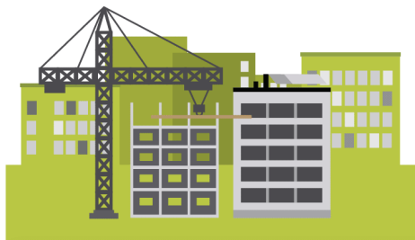
Kestävä rakentaminen ja liikkuminen