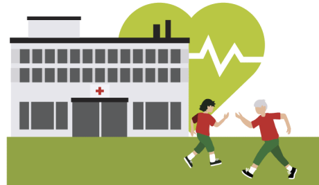
Terveyden ja hyvinvoinnin ala