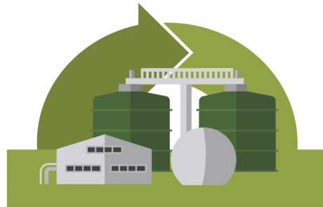
Innovatiivinen bio- ja kiertotalous