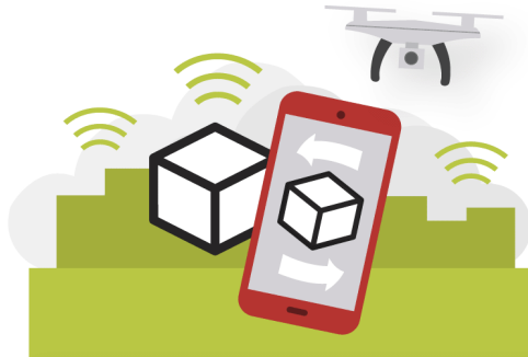
Digitaaliset palvelut ja tuotteet