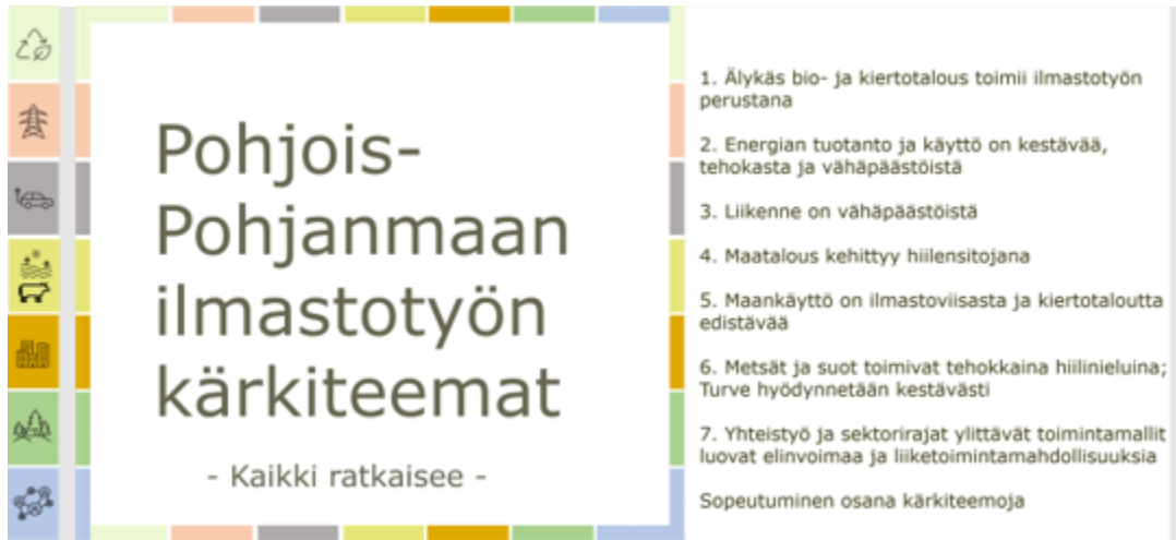
Kuva: Pohjois-Pohjanmaan ilmastotiekartan 2021–2030 kärkiteemat