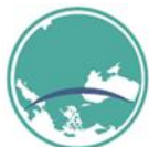
CPMR BALKAN & BLACK SEA COMMISSION